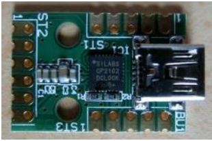
Mini-USB-UART-Umsetzer UM2102 von ELV

Mit dem Modul UM2102 von ELV ist es jetzt möglich, ein PTT-Mikrofon auch direkt mit einem USB-Kabel zu versehen. Das Modul verfügt über eine USB-Mini-Printprint-Buchse und kann im Mikrofongehäuse untergebracht werden. PTT und Up-/Down werden dann über das USB-Kabel geschaltet. Leider muss für die NF ein zweites Kabel mit 3,5mm-Klinkenstecker aus dem Mikrofongehäuse geführt werden.